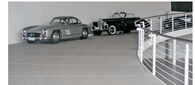
MultiColor-System in einem privaten Automuseum

Und weil sie nahezu auf jedem Untergrund einsetzbar sind, ist eine Beschichtung auch an Wandflächen möglich. So können Böden, Wände und Möbel aus dem gleichen Material hergestellt werden. Auch eine metallische Optik ist kein Problem.