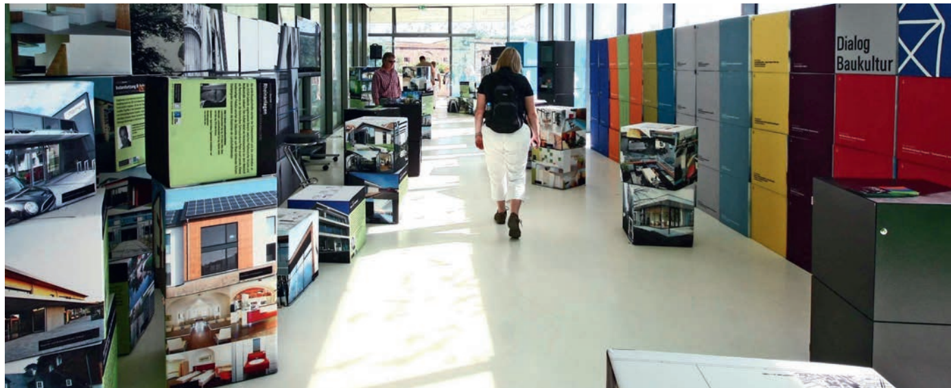
Pavillon Bundesgartenschau Koblenz 2011

Unsere Böden sind natürlich auch AgBB geprüft (Ausschuss zur gesundheitlichen Bewertung von Bauprodukten) und damit perfekt für den Einsatz in allen Wohnräumen, sowie auch in sensiblen Bereichen, wie z. B. in Krankenhäusern und Kindergärten, geeignet.