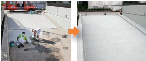
Epoxidharz-Beschichtung einer Tiefgaragenzufahrt (OS 8)

Kaufhaus, Industriegebäude, Ladenlokal oder Privaträume: Wir kennen den perfekten Boden für jede Herausforderung und für jede mögliche Belastung. Als 1-K-Anstrich oder 2-K-Beschichtung – Bodenbeschichtungen von Moseler bieten dauerhaften, widerstandsfähigen Schutz in jeder Situation. Fragen Sie uns und wir sagen, worauf Sie am besten stehen.