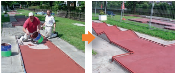
Mineralische Beschichtung einer Minigolf-Anlage (Hochwasserbereich)

Wenn wir Langlebigkeit sagen, wissen wir, wovon wir sprechen. Unser Betrieb besteht seit 1888 und ist bereits in der sechsten Generation im Familienbesitz. Was wir tun, haben wir von der Pike auf gelernt. Und machen es mit Leidenschaft sowie der Erfahrung aus über 125 Jahren Handwerk und Sachverstand. Verlassen Sie sich darauf.