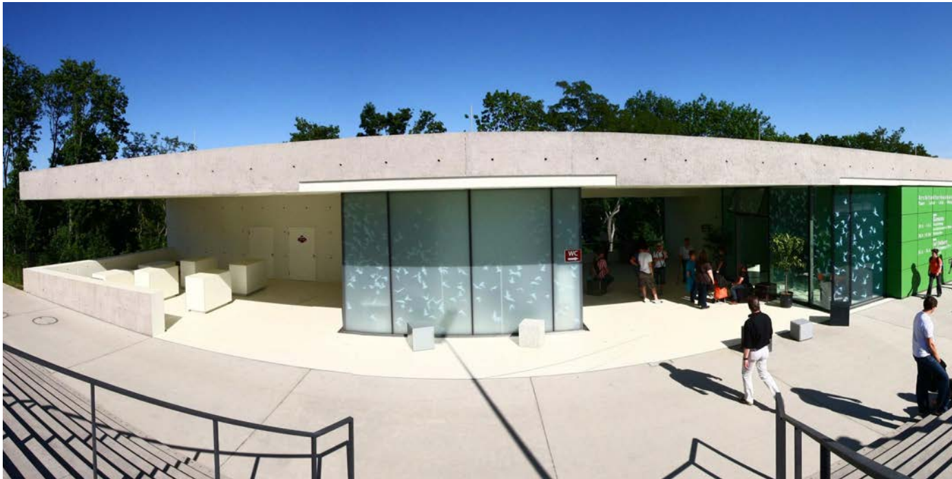
Pavillon Bundesgartenschau Koblenz 2011

Wir zeigen Ihnen die unendlichen Möglichkeiten und finden mit Ihnen zusammen den Fußboden, der zu Ihnen passt. Mit oder ohne Muster und genau in der Farbe, die Sie sich vorstellen. Rutschhemmend oder glatt, immer fugenlos und einfach zu reinigen. Immer langlebig und widerstandsfähig.