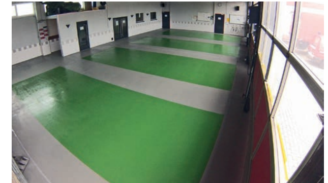
Parkfläche Feuerwehr Neuwied

Vor allem in Küchen oder der lebensmittelverarbeitenden Industrie ist Hygiene eine der größten Herausforderungen an Fußböden und bedeutet zugleich, dass die Beschichtung eine Menge aushalten muss. Häufiges Reinigen und aggressive Desinfektionsmittel dürfen die Struktur des Bodens nicht angreifen. Zugleich muss die Reinigung leicht von der Hand gehen. Dabei helfen glatte Oberflächen, Hohlkehlen in den Ecken, ein Gefälle zum Abfluss und wenig Fugen. Und natürlich das beste Material für die Beschichtung. Wir wissen worauf es ankommt. Fragen Sie uns!