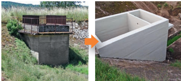
Instandsetzung eines Regenüberlaufbeckens

Wenn wir Langlebigkeit sagen, wissen wir, wovon wir sprechen. Unser Betrieb besteht seit 1888 und ist bereits in der sechsten Generation im Familienbesitz. Was wir tun, haben wir von der Pike auf gelernt. Und machen es mit Leidenschaft sowie der Erfahrung aus über 125 Jahren Handwerk und Sachverstand. Verlassen Sie sich darauf.