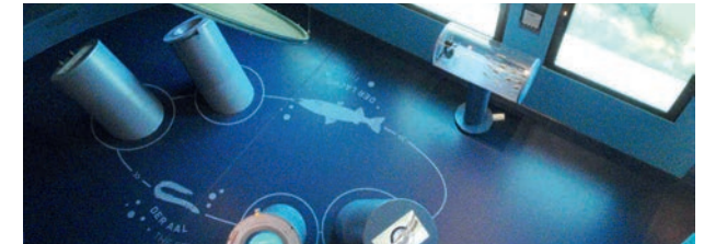
Dekorative Bodenbeschichtung (Mosellum Erlebniswelt Koblenz)