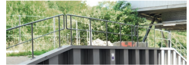
Bodenbeschichtungen (Bundesgartenschau Koblenz 2011)