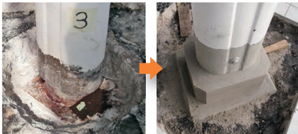
Sanierung tragender Konstruktionen

Nachhaltig zu arbeiten bedeutet für uns: Wir besuchen Sie vor Ort und nehmen Ihr Problem genau unter die Lupe. Dann suchen wir gemeinsam mit Ihnen nach einer technisch und wirtschaftlich optimalen Lösung. Anschließend erhalten Sie von uns ein umfangreiches und detailliertes Angebot, das wir gerne mit Ihnen gemeinsam besprechen.