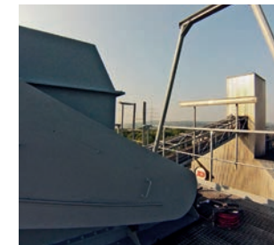
Korrosionsschutzbeschichtung (Dunlop Wittlich)